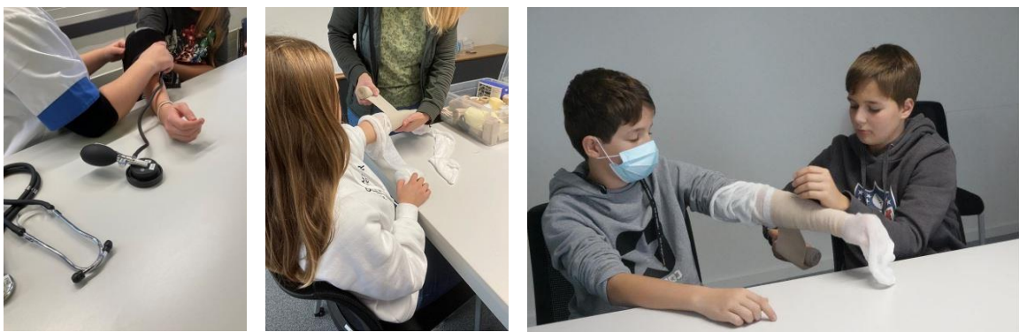
2 Blutdruck messen und Verband anlegen